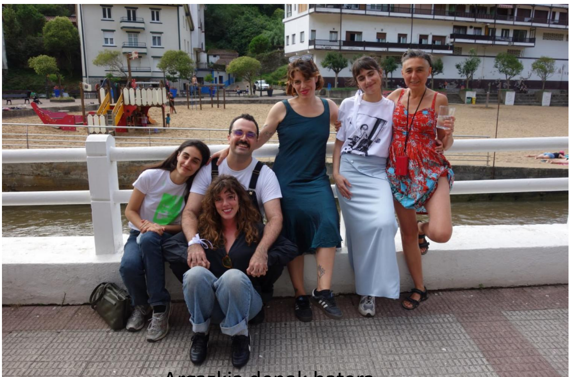
Argazkia denak batera

Unea iritsi arte ez diogu ekingo! Hau guztia, egon ez bazina ere.