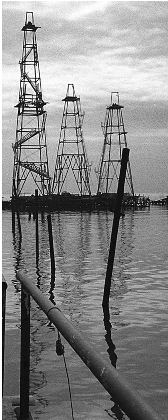
Leku arriskutsuetako soinuak Sonidos de lugares peligrosos